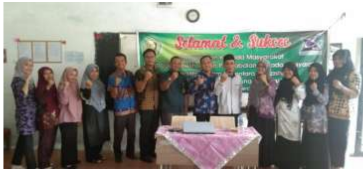
Gambar 4.1 Kegiatan Sosialisasi Pengabdian Kepada Masyarakat

Kegiatan PkM yang dilaksanakan dengan acara tatap muka. Pertemuan tatap muka dengan metode ceramah dan demonstrasi. Kegiatan ini dilaksanakan sehari pada hari Sabtu tanggal 07 Desember 2019 dari pukul 10.00 – 13.00 WIB. Peserta kegiatan tenaga pendidik dan siswa SMA Pembangunan Perbaungan.