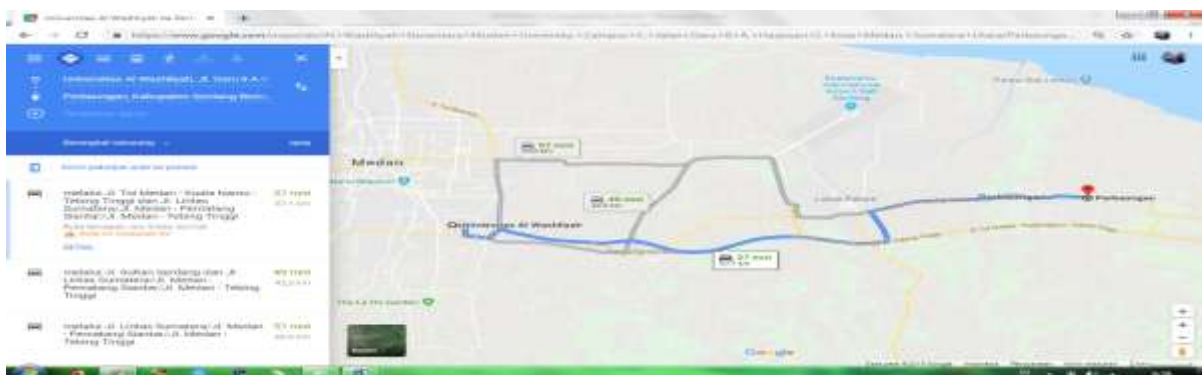
Gambar. 1.1 Peta Medan- Perbaungan

Hal ini menyebabkan terjadi ketimpangan serta kesalahan penggunaan bahasa di ruang publik yang seharusnya mengutamakan penggunaan Bahasa Indonesia. Kegiatan pembinaan dan upaya penyuluhan tentang kebahasaan sebaiknya dilakukan dengan cara terukur dan terstruktur agar siswa mampu menerima dan mengaplikasikan segala pengetahuan dan wawasan yang diperoleh dengan menerapkan berbahasa yang baik secara formal dalam setiap komunikasi diruangan publik. Penggunaan bahasa yang baik di SMA Pembangunan Perbaungan Kabupaten Serdang Bedagai dapat tercipta salah satunya dengan upaya penyuluhan dan pembinaan penggunaan Bahasa Indonesia dengan menggunakan Ragam Formal sebagai salah satu cara terbaik memecahkan permasalahan penggunaan Bahasa dikalangan siswa yang cenderung kurang tepat.