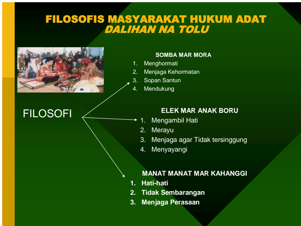
Gambar 3. Filosofi Masyarakat Adat Dalihan na Tolu

Keempat tingkatan musyawarah di atas merupakan tingkatan berjenjang dan bersifat hirarkis yang harus dilalui secara berurutan dalam setiap penyelesaian pelaksanaan perlindungan dan penyelesaian sengketa lingkungan hidup. Jika terjadi sengketa lingkungan hidup, terlebih dahulu diselesaikan dalam musyawarah tingkatan pertama. Jika musyawarah dalam tingkatan ini dianggap masalah sudah selesai, maka tidak perlu lagi musyawarah dilanjutkan dalam tingkatan selanjutnya. Tetapi jika masalah atau sengketa belum selesai dalam musyawarah pada tingkatan yang pertama, maka dilanjutkan pada musyawarah tingkatan kedua, dan jika masalah atau sengketa belum juga bisa diselesaikan, maka dilanjutkan pada musyawarah dalam tingkatan yang keempat. Lebih jelasnya dapat dilihat dalam tabel di bawah: