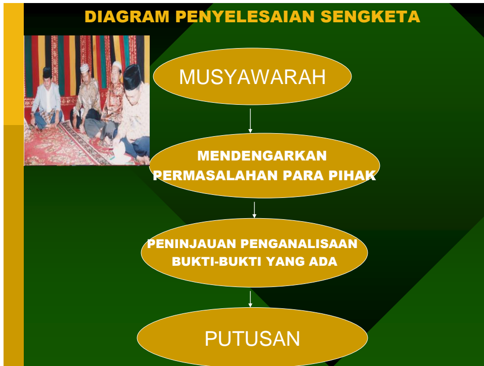
Gambar 3. Musyawarah yang Diselenggarakan oleh Harajaon , Hatobangon dan Perwakilan Masyarakat Adat Batak

Musyawarah merupakan asas hukum adat yang penting, karena melalui musyawarah, masyarakat adat dapat mencapai kesepakatan terhadap pelaksanaan suatu kegiatan dan penyelesaian sengketa. 154 Melalui musyawarah suatu masalah dan sengketa dapat diselesaikan dengan baik, arif, bijaksana dan berkeadilan. Musyawarah yang didasari dengan kerelaan dan keikhlasan adalah sangat dibudayakan dalam masyarakat adat Batak. Sebaiknya setiap hasil musyawarah dibarengi dengan perjanjian, supaya mempunyai kekuatan hukum tetap. Adapun syarat-syarat subyektif dan obyektif suatu perjanjian adalah :