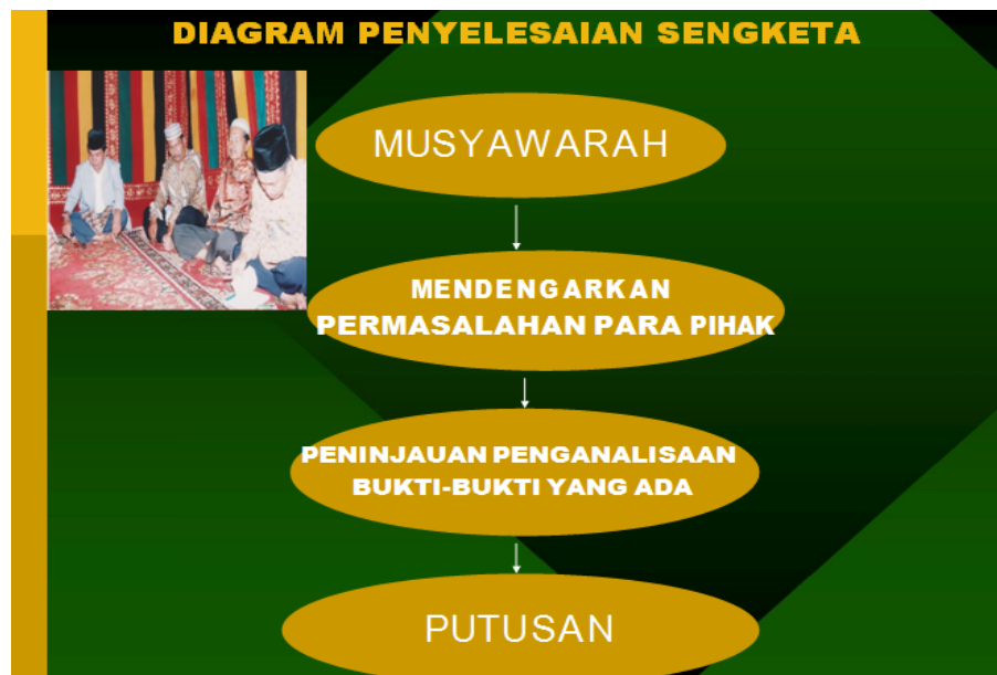
Gambar 3. Musyawarah yang Diselenggarakan oleh

Melalui musyawarah suatu masalah dan sengketa dapat diselesaikan dengan baik, arif, bijaksana dan berkeadilan. Musyawarah yang didasari dengan kerelaan dan keikhlasan adalah sangat dibudayakan dalam masyarakat adat Batak.