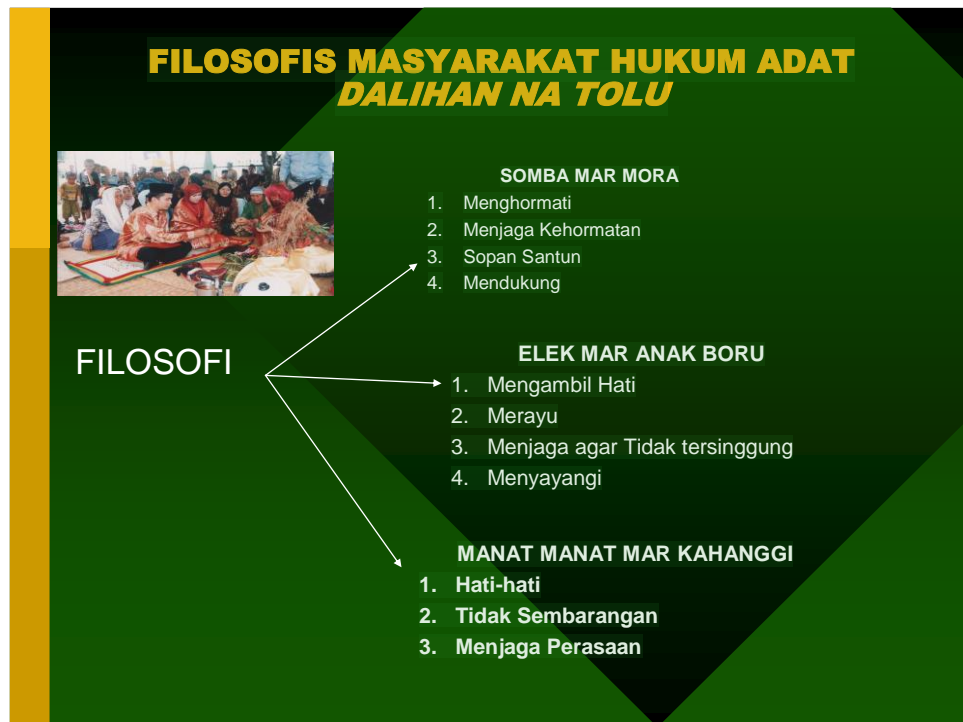
Gambar 3. Filosofi Masyarakat Adat Dalihan na Tolu

Keempat tingkatan musyawarah di atas merupakan tingkatan berjenjang dan bersifat hirarkis yang harus dilalui secara berurutan dalam setiap penyelesaian pelaksanaan perlindungan dan penyelesaian sengketa lingkungan hidup. Jika terjadi sengketa lingkungan hidup, terlebih dahulu diselesaikan dalam musyawarah tingkatan pertama. Jika musyawarah dalam tingkatan ini dianggap masalah sudah selesai, maka tidak perlu lagi musyawarah dilanjutkan dalam tingkatan selanjutnya. Tetapi jika masalah atau sengketa belum selesai dalam musyawarah pada tingkatan yang pertama, maka dilanjutkan pada musyawarah tingkatan kedua, dan jika masalah atau sengketa belum juga bisa diselesaikan, maka dilanjutkan pada musyawarah dalam tingkatan yang keempat. Lebih jelasnya dapat dilihat dalam tabel di bawah: