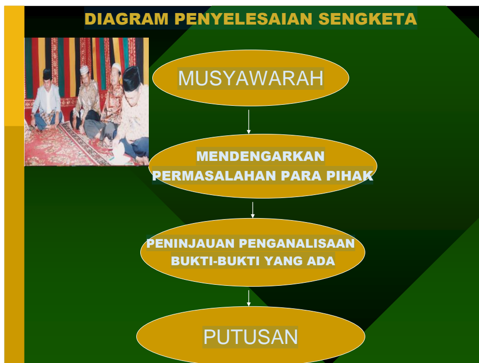
Gambar 3. Musyawarah yang Diselenggarakan oleh Harajaon , Hatobangon dan Perwakilan Masyarakat Adat Batak

Musyawarah merupakan asas hukum adat yang penting, karena melalui musyawarah, masyarakat adat dapat mencapai kesepakatan terhadap pelaksanaan suatu kegiatan dan penyelesaian sengketa. 148 Melalui musyawarah suatu masalah dan sengketa dapat diselesaikan dengan baik, arif, bijaksana dan berkeadilan. Musyawarah yang didasari dengan kerelaan dan keikhlasan adalah sangat dibudayakan dalam masyarakat adat Batak. Sebaiknya setiap hasil musyawarah dibarengi dengan perjanjian, supaya mempunyai kekuatan hukum tetap. Adapun syarat-syarat subyektif dan obyektif suatu perjanjian adalah :